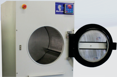
AMPLA ABERTURA DE PORTA Facilita as etapas de carga e descarga