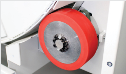
ROLETES DE TRANSMISSÃO MECÂNICA